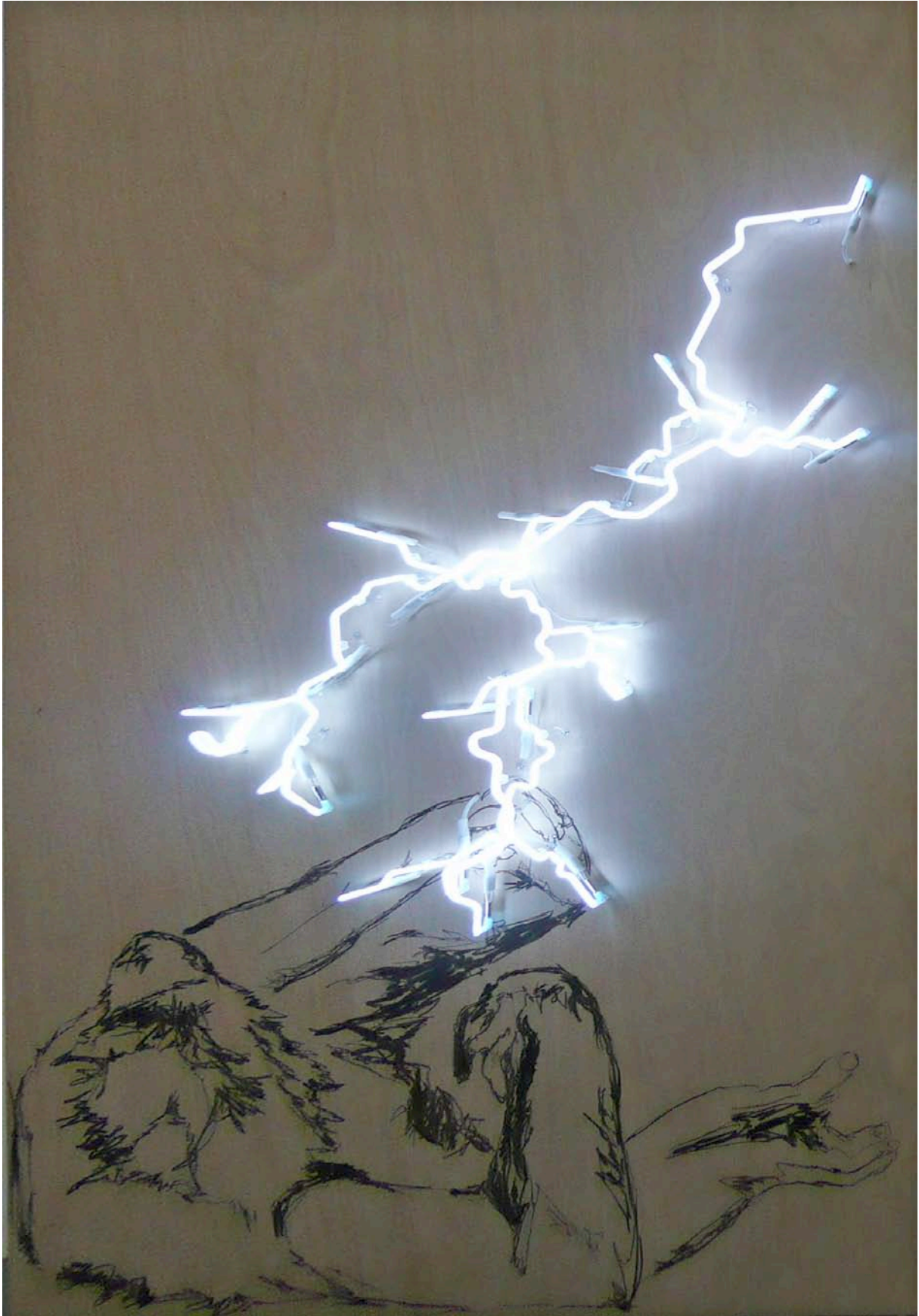
Une nuit d'été néon bois fusain 230x150 cm