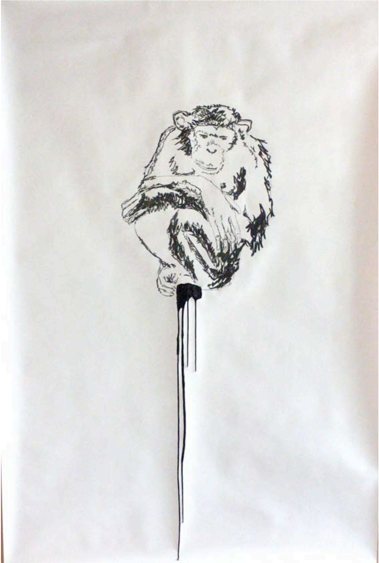
Sans titres Fusain encre de chine 205x150 cm