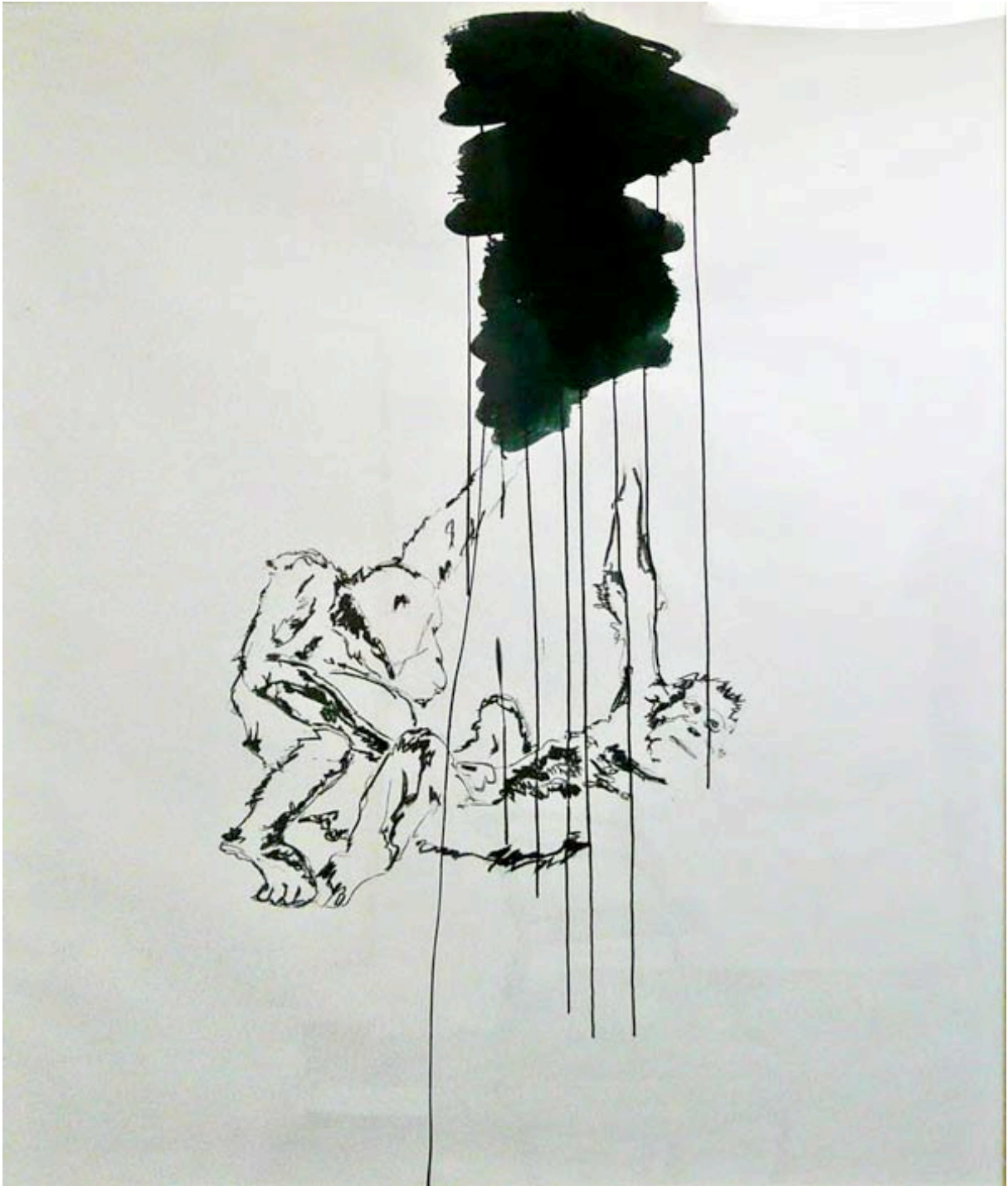
sans titre fusain encre de chine 183x150 cm