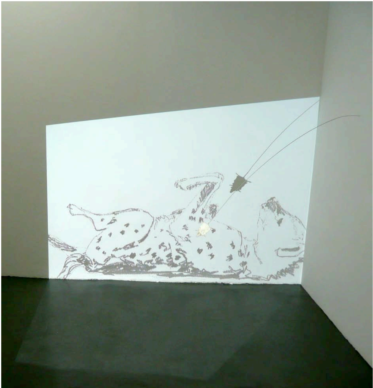
hyènes à la souris Dimension variable Dessin animé, souris