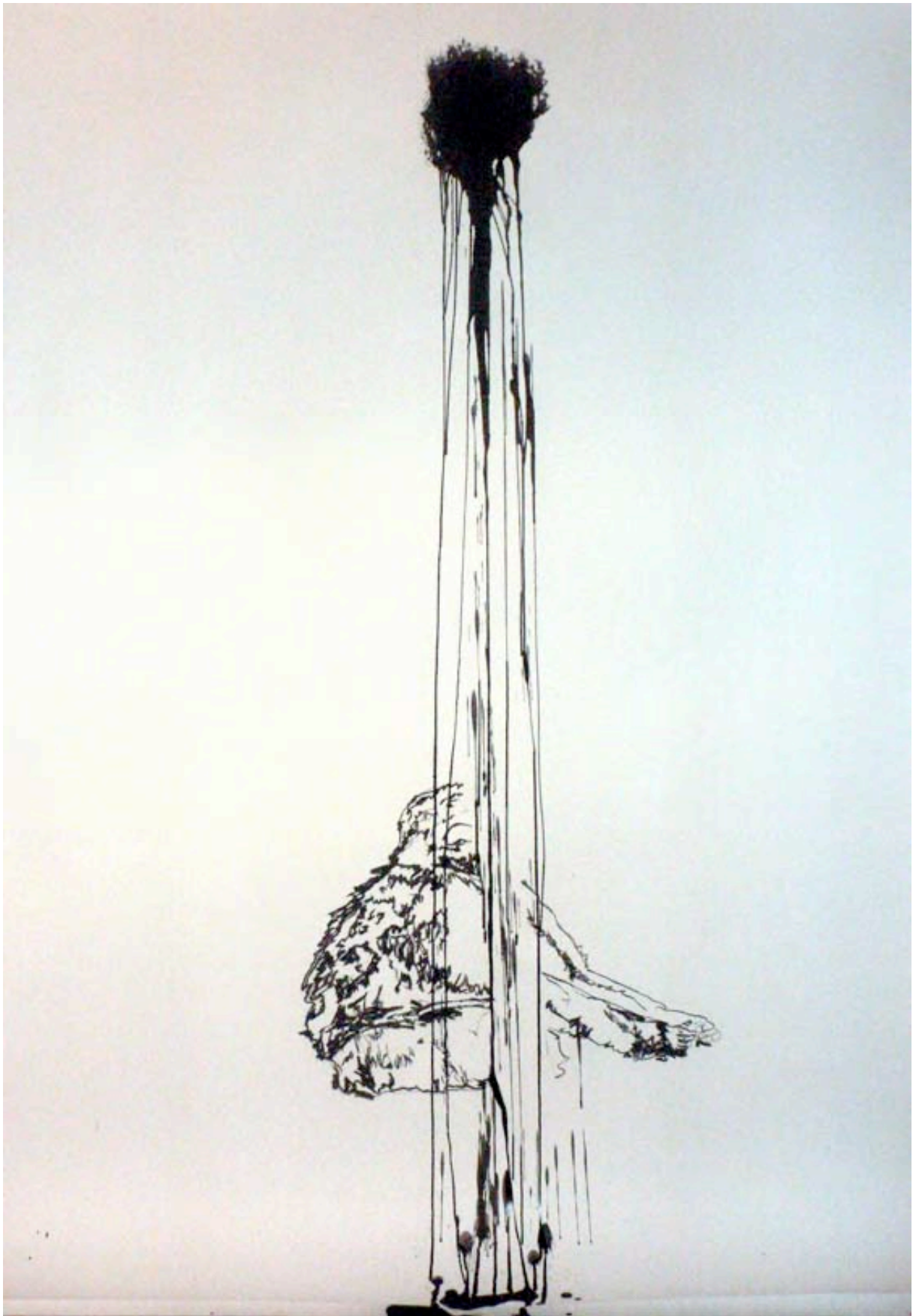
Sans titres Fusain encre de chine 205x150 cm