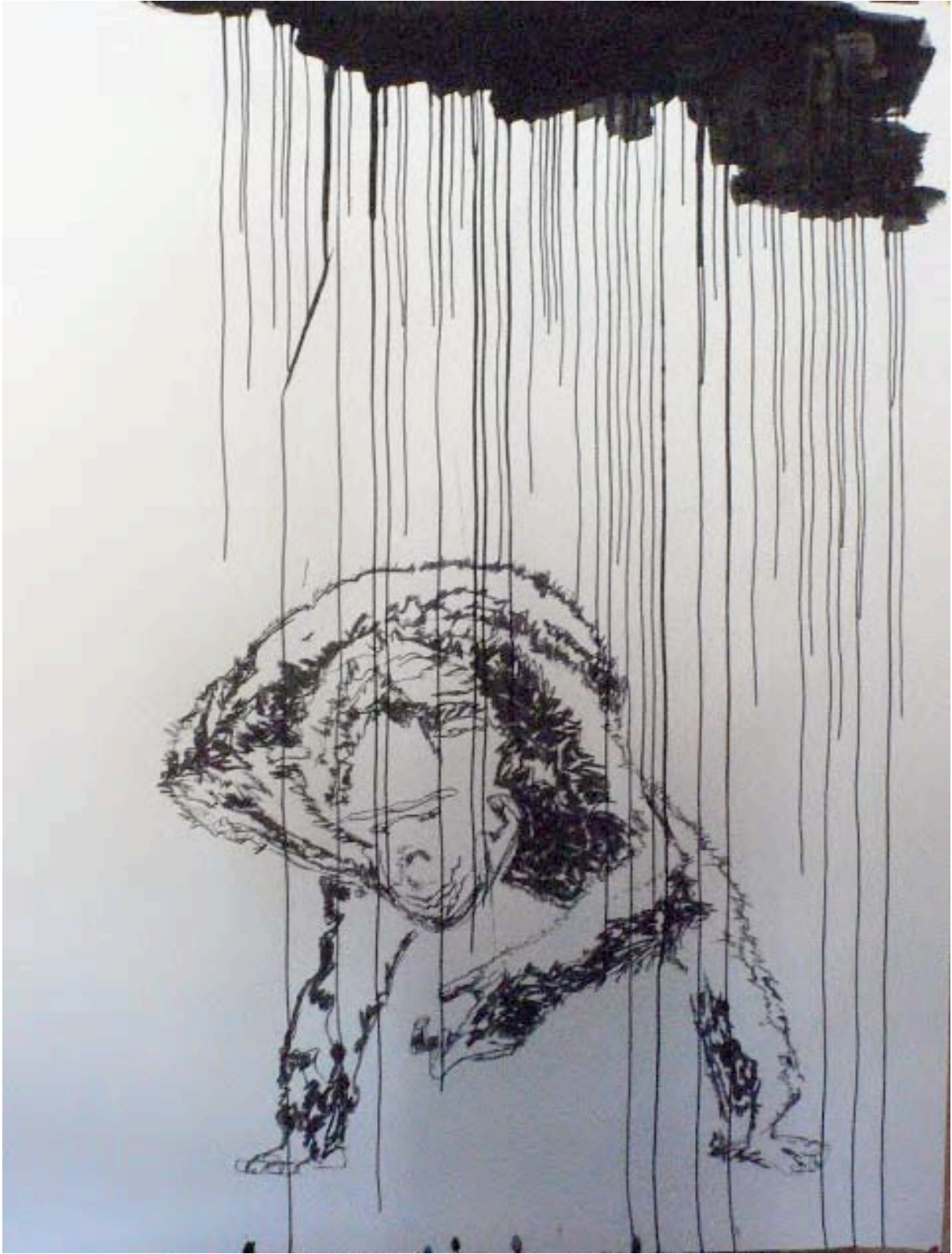
sans titre fusain encre de chine 190x150 cm