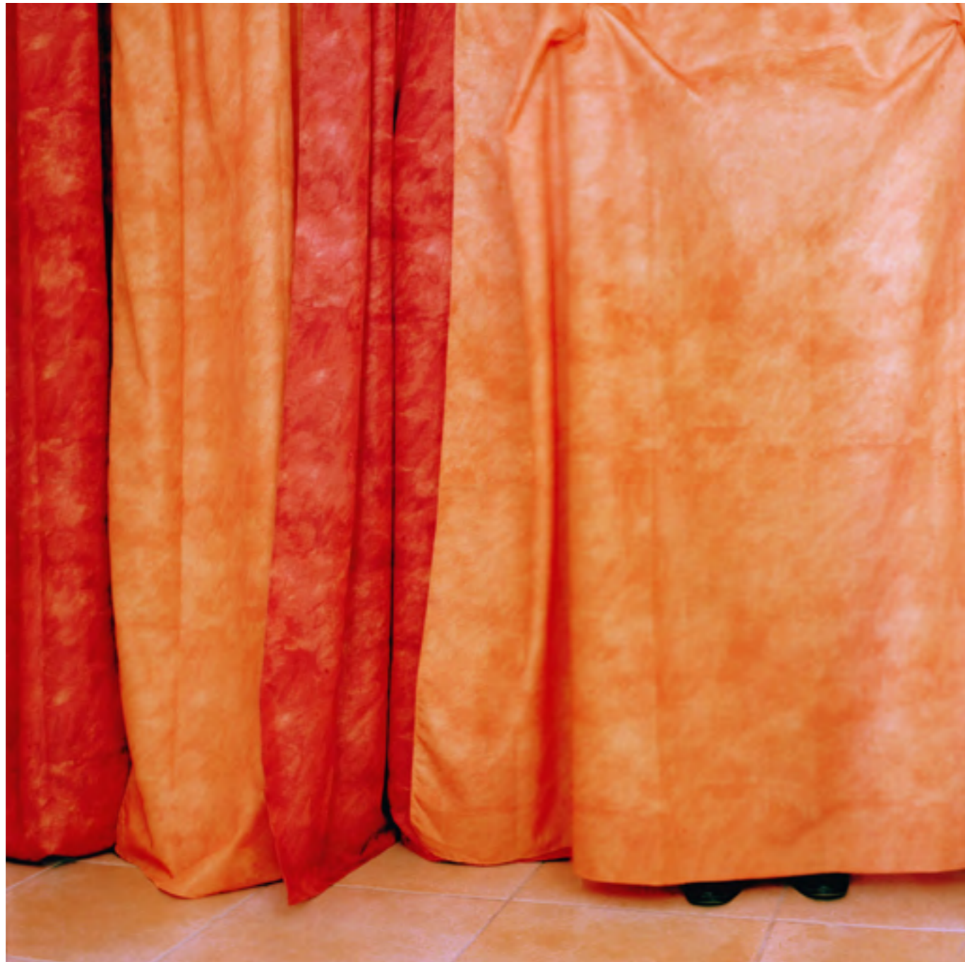
Sans titre n°1 (Bienvenue Nelson) , 2006 Photographie couleur; contrecollage sur dibond 121 x 121 cm