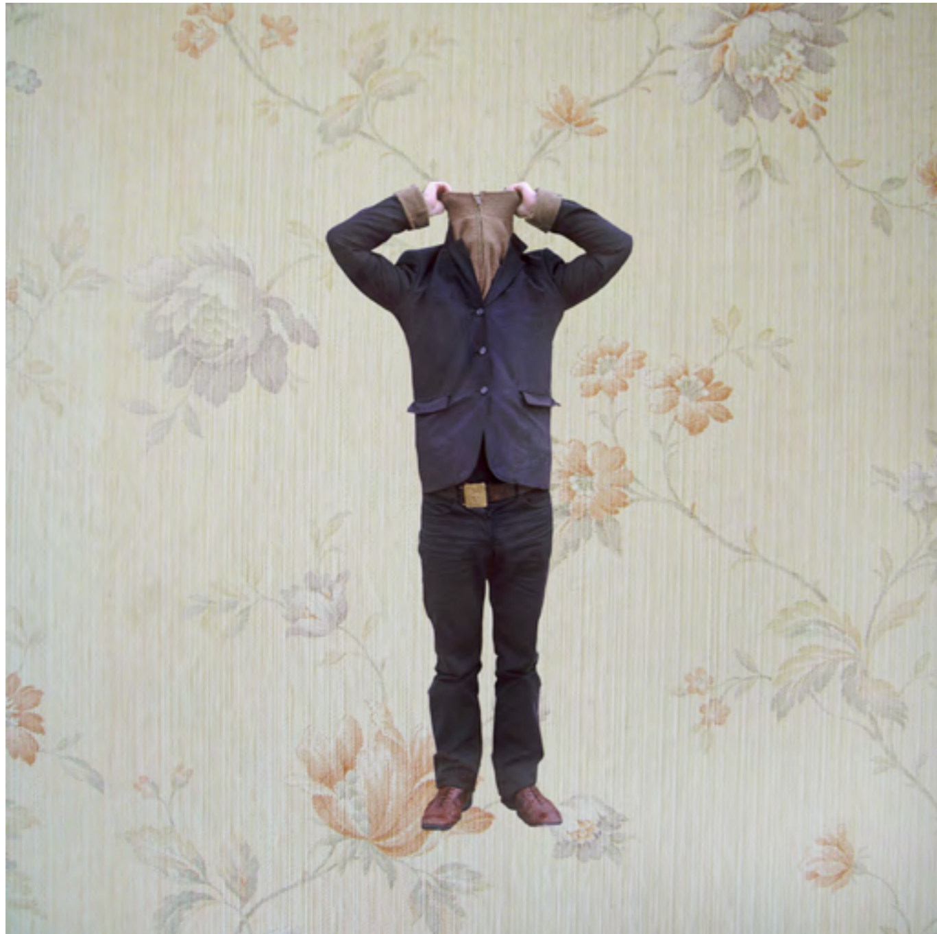
Sans titre n°1 (Les Papiers peints) , 2006 Photographie couleur; contrecollage sur aluminium, 30 x 30 cm