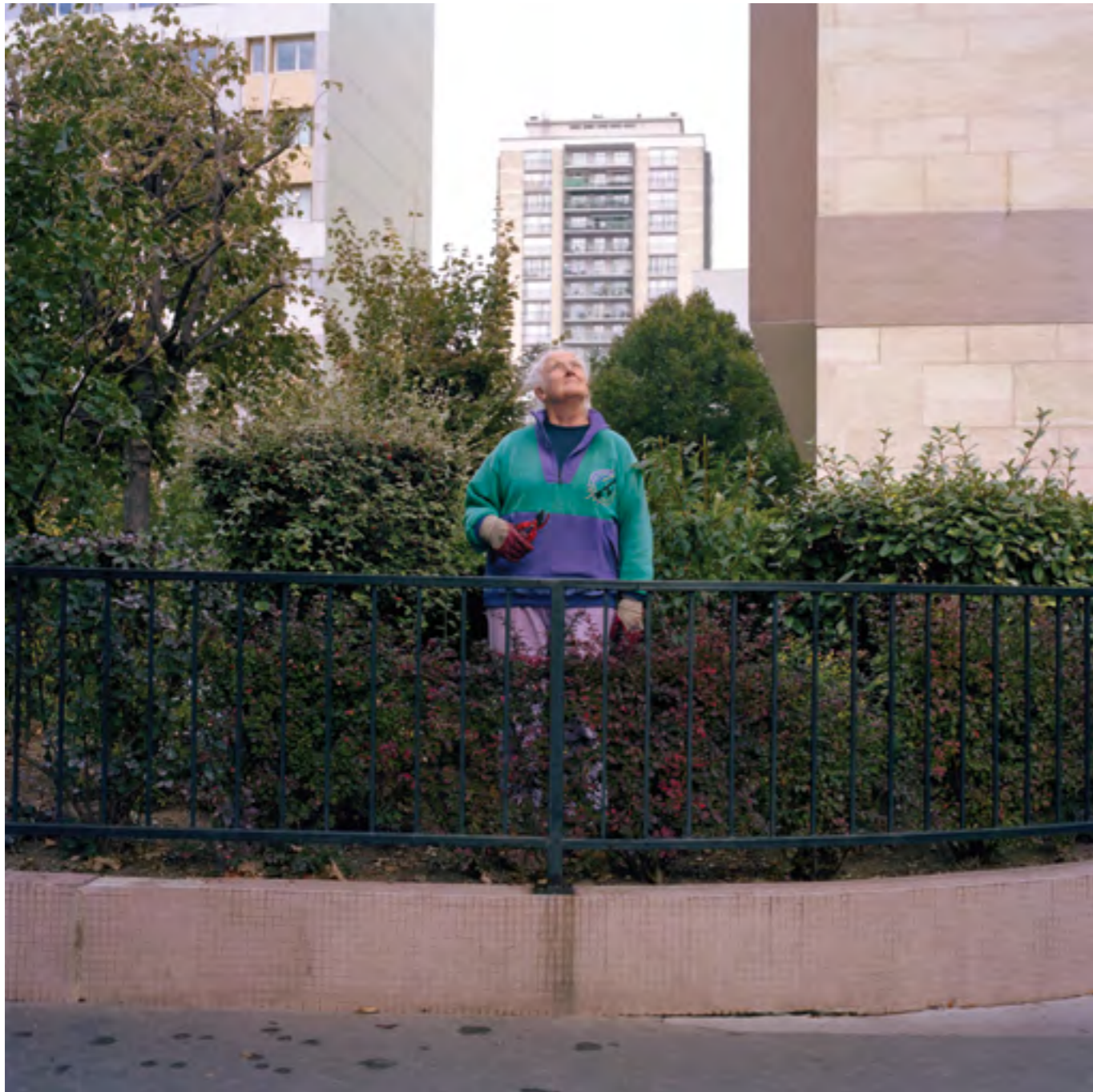
Sans titre n°4 (L'Histoire à dix personnages) , 2007 Photographie couleur; contrecollage sur dibond 90 x 90 cm