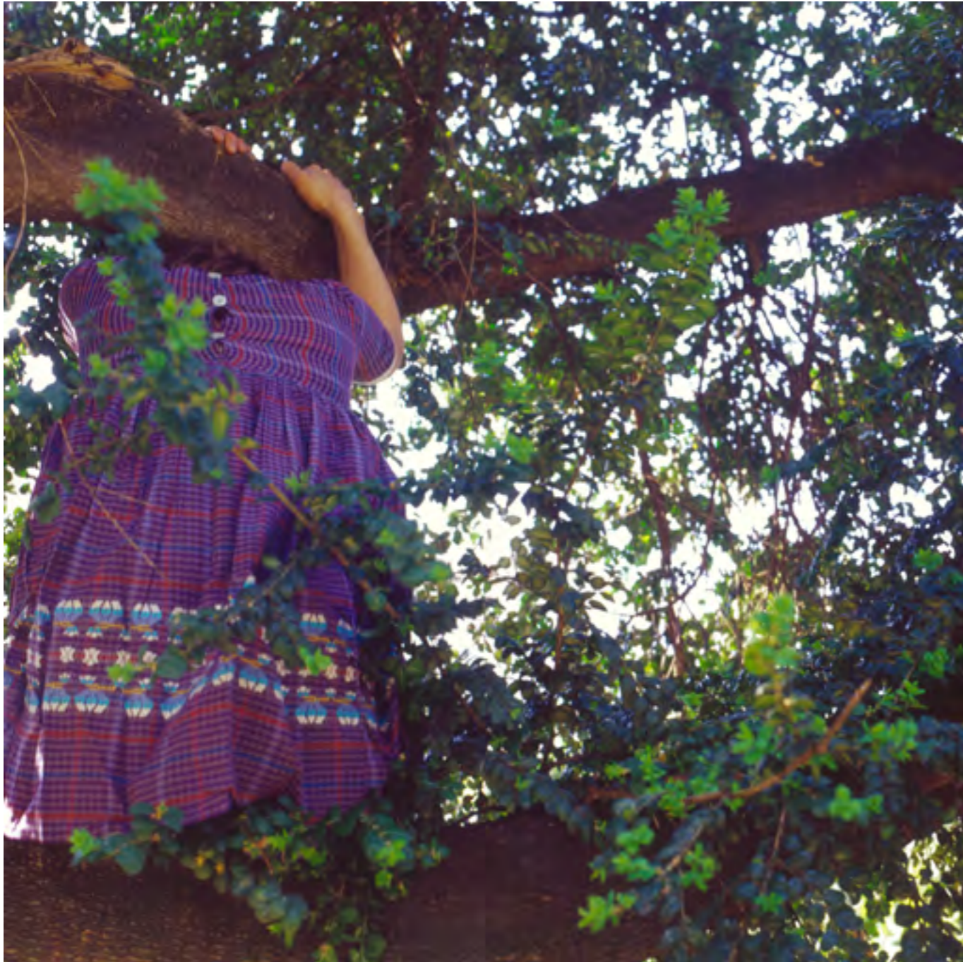
L'arbre , 2008 Photographie couleur