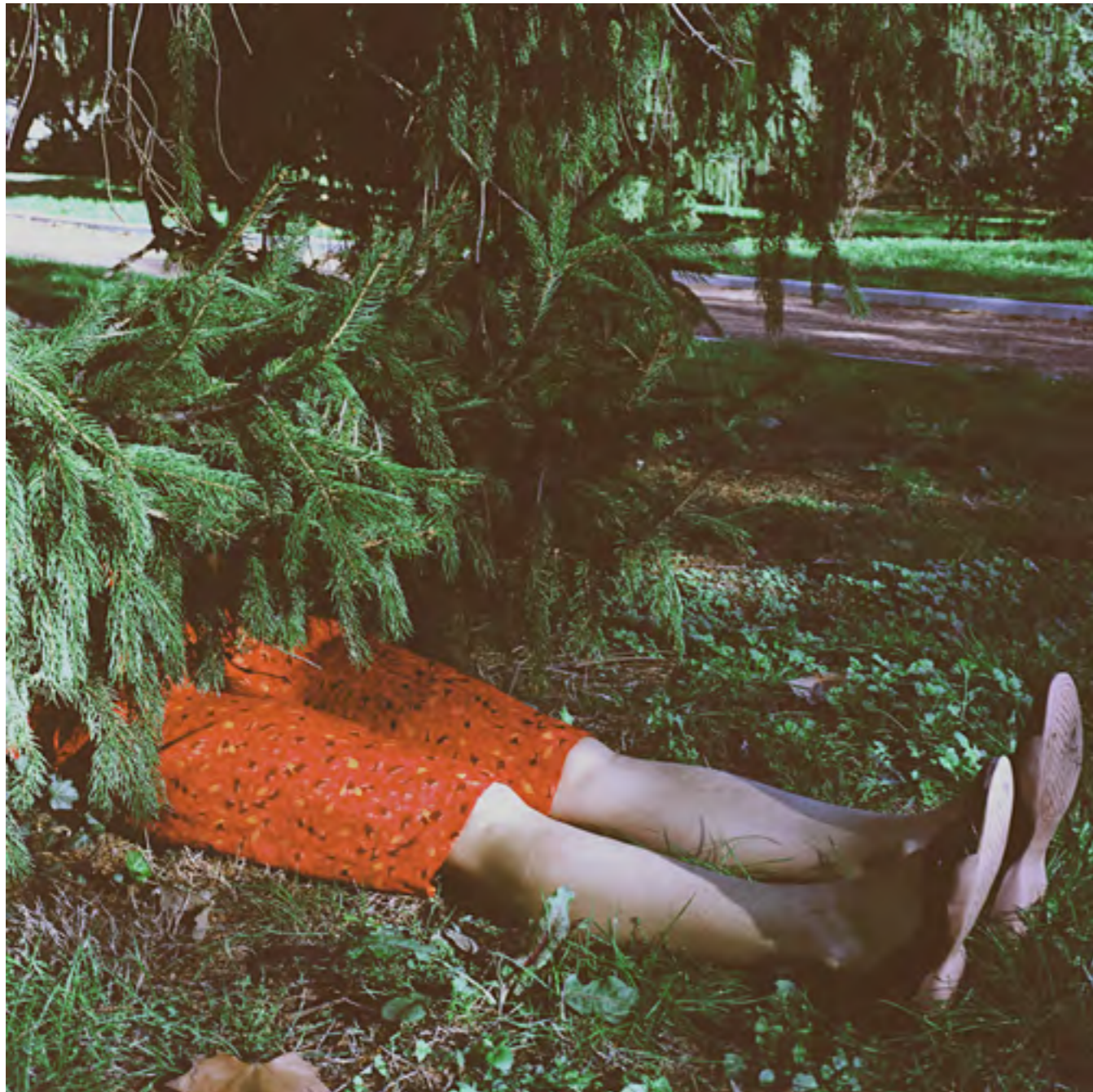
Sans titre n°6 (Les secrets) , 2006 Photographie couleur; contrecollage sur aluminium 60 x 60 cm