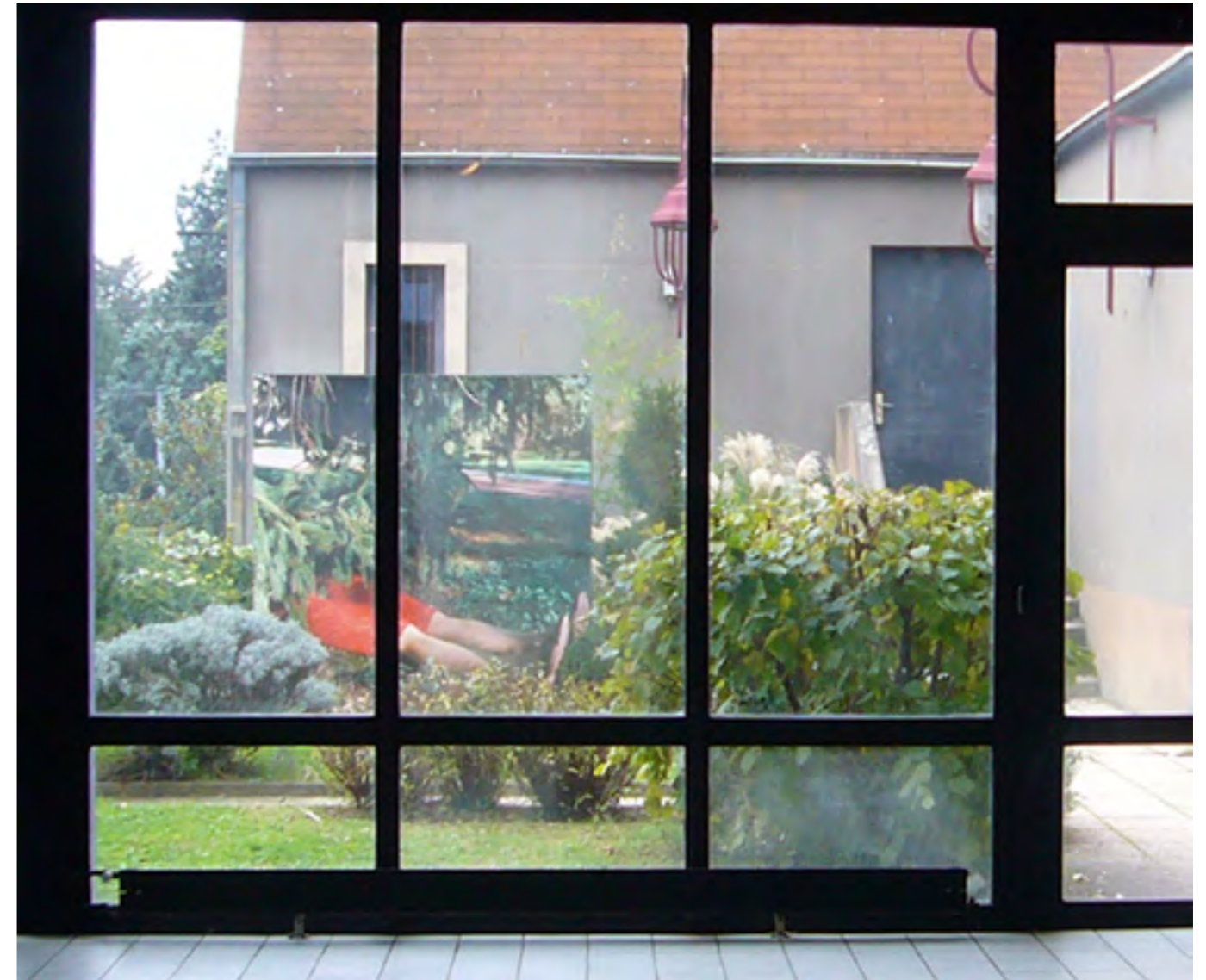
Photographie couleur; impression sur bâche, châssis, 200 x 200 cm