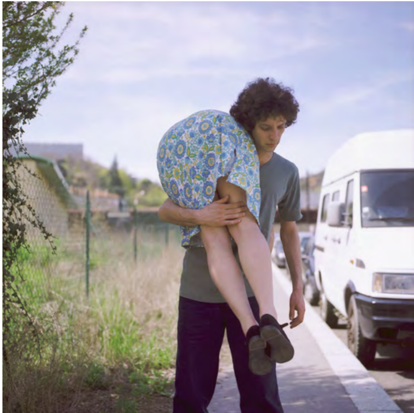
Sans titre n°1 (Les accessoires) , 2006 Photographie couleur; contrecollage sur dibond 120 x 120 cm