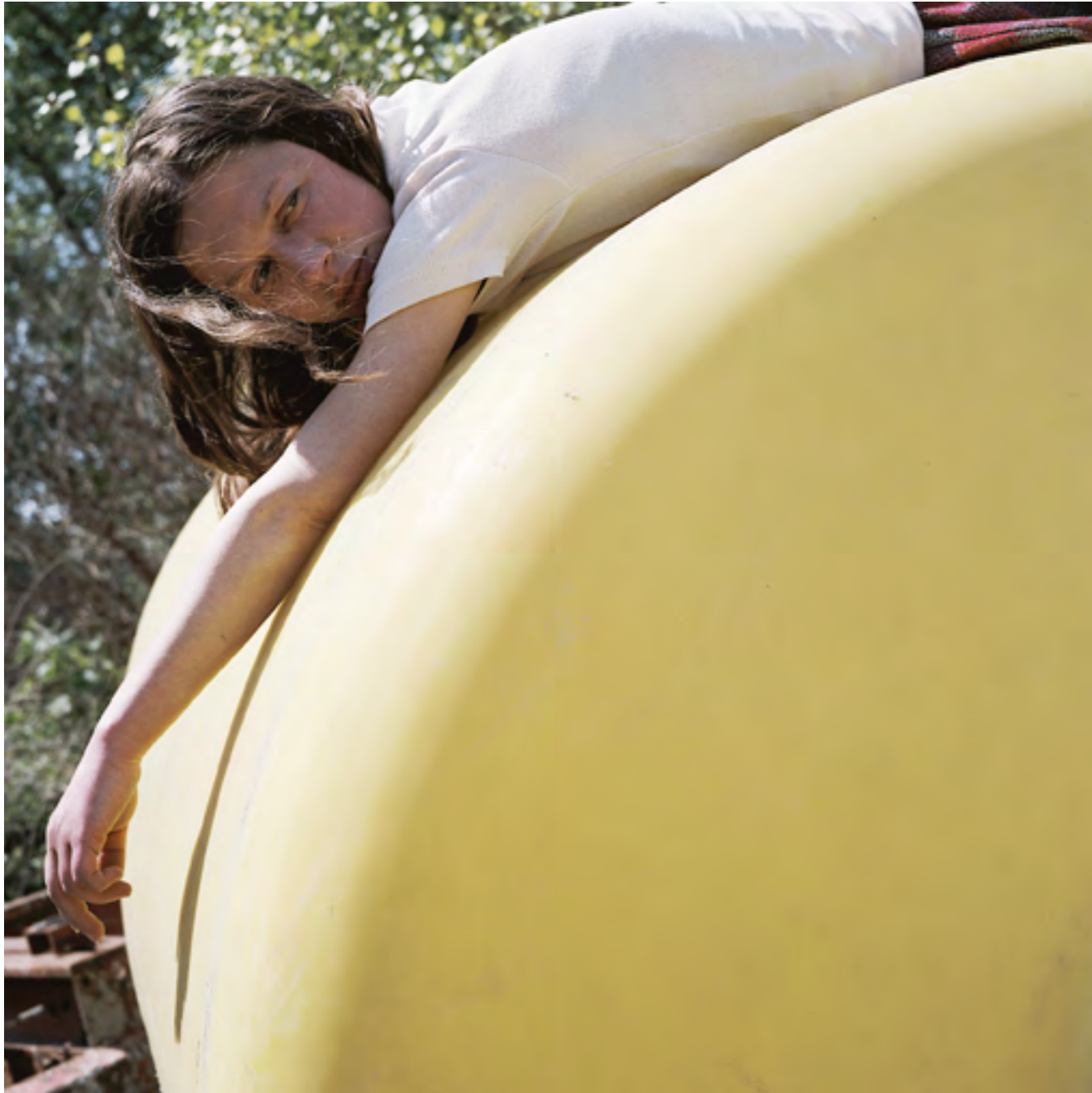
Attitude n° 10 (Attitude) , 2003 Photographie couleur; contrecollage sur aluminium 80 x 80 cm