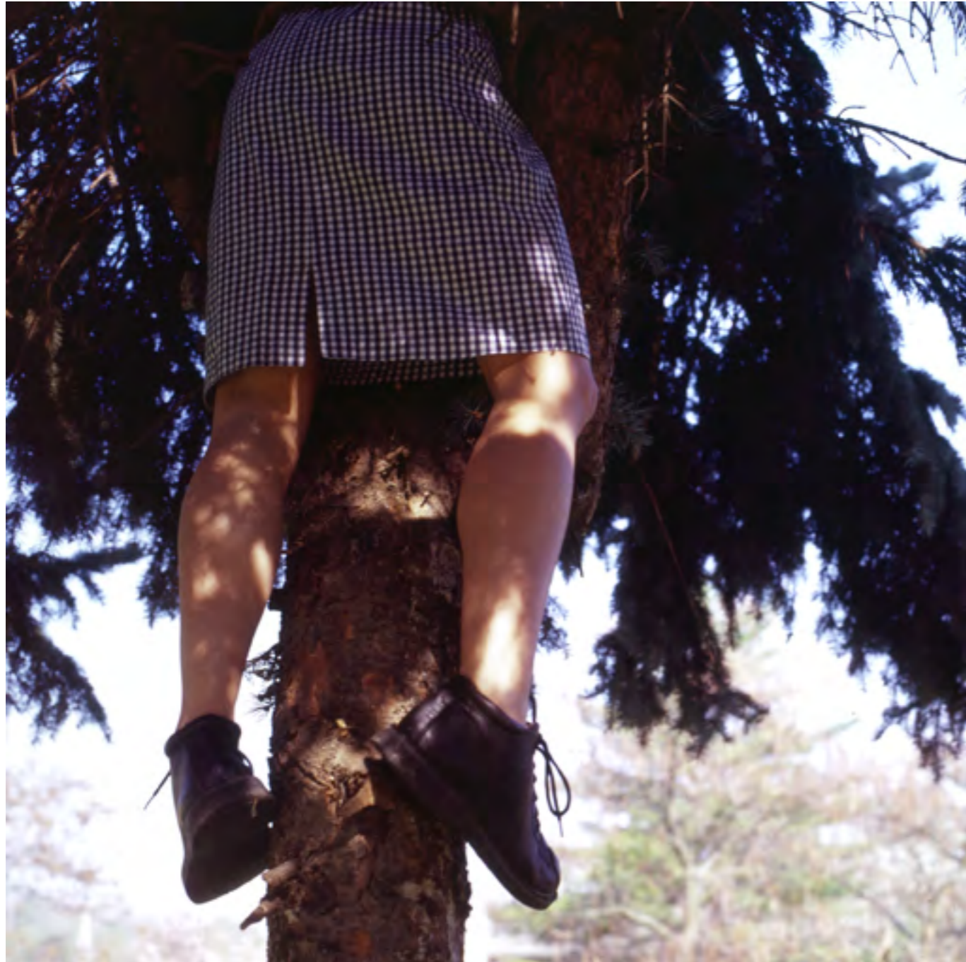
Sans titre n°4 (Les secrets) , 2005 Photographie couleur; contrecollage sur aluminium 60 x 60 cm