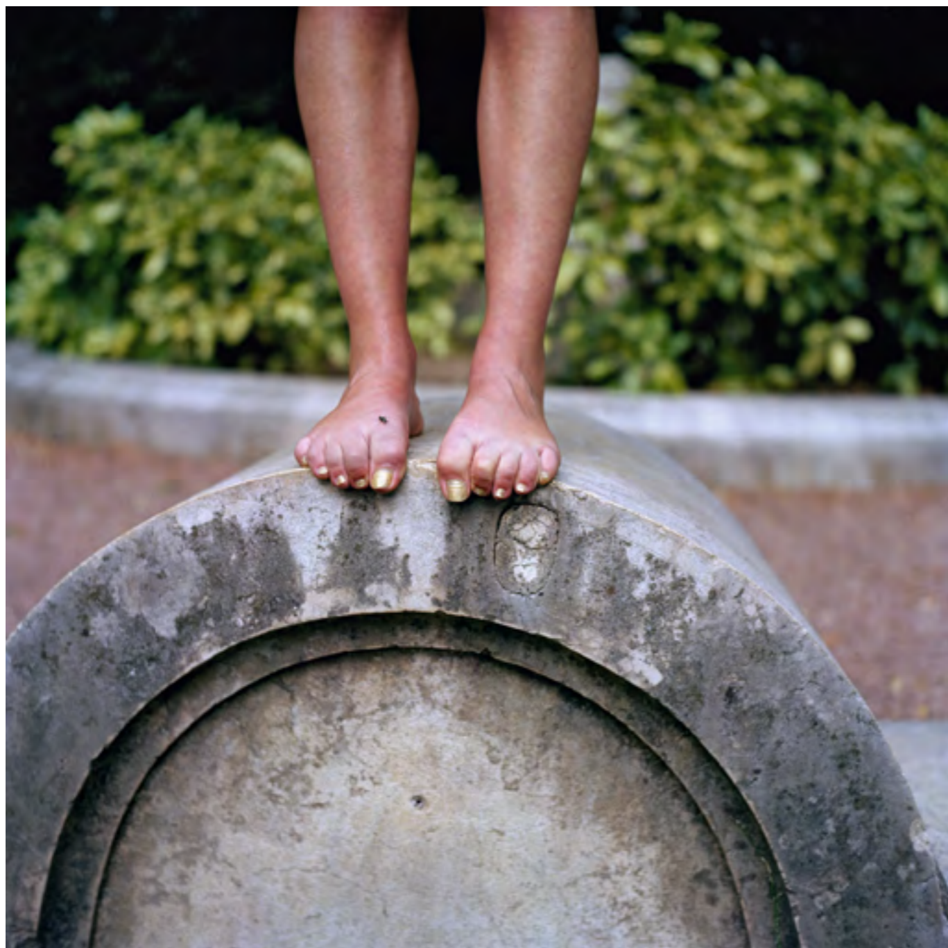
Sans titre n°5 (Marque de fabrique), 2003 Photographie couleur; contrecollage sur dibond 100 x 100 cm