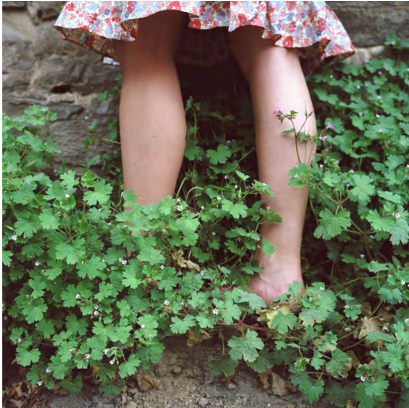
Sans titre , 2004 Photographie couleur, impression jet d'encre sur papier affiche 248 x 378 cm